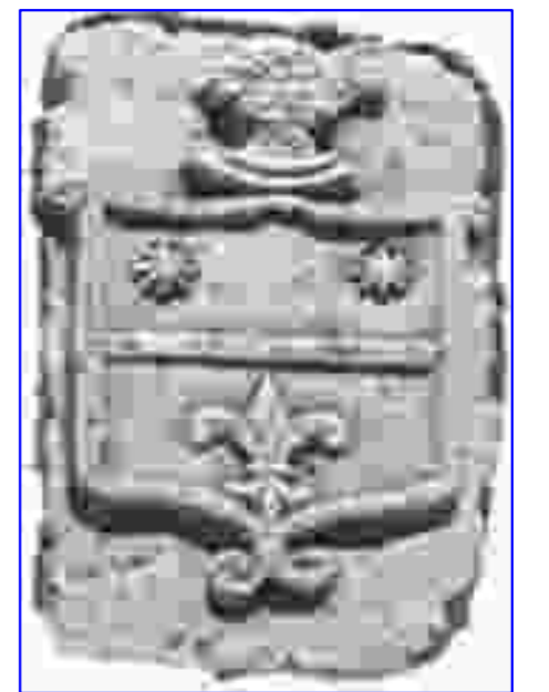
Stemma della famiglia MESSONE scolpito su pietra sulla facciata dell'antica casa "palazzina" MESSONE in via S. Egidio n. 40 di Altavilla del Principato Citra (ora Altavilla Sentina). Il giglio, la linea orizzontale e l'elfigo di un guerriero simboleggiano la purezza, la correttezza e l'origine della famiglia.